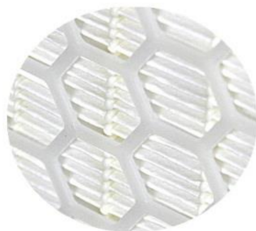
DETAIL DU SET FILTRANT SPECIAL POUR TURBOGAZ

A PEDIDO ESTÁN DISPONIBLES DIMENSIONES O VERSIONES DISTINTAS VERSIONES CON 2 REDES (MOD. _TG/2) U 8 REDES (MOD. _TG/8) DE PLÁSTICO REUTILIZABLES A PEDIDO