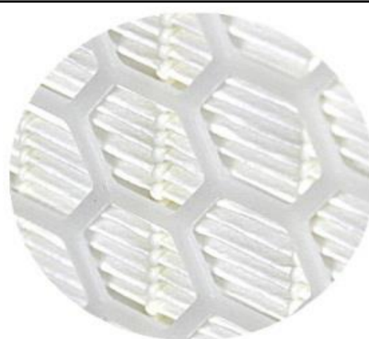
DETAIL DU SET FILTRANT SPECIAL POUR TURBOGAZ

A PEDIDO ESTÁN DISPONIBLES DIMENSIONES O VERSIONES DISTINTAS VERSIONES CON 2 REDES (MOD. _TG/2) U 8 REDES (MOD. _TG/8) DE PLÁSTICO REUTILIZABLES A PEDIDO