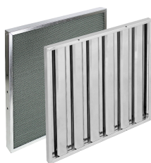
Celle per nebbie oleose